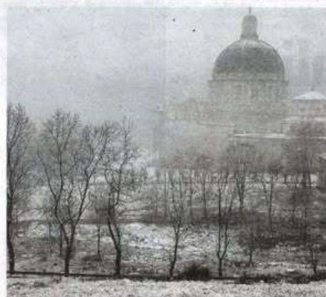
La prima (e poca) neve dell'anno ieri a Oropa

Se il 2022 ha anche il record di anno più secco di sempre, il 2024 almeno da questo punto di vista ha fatto registrare una tendenza ben diversa: i 2.758,4 millimetri di pioggia caduti a Oropa sono ben al di sopra della media storica di 2.038,9 millimetri. L'ultimo anno sopra quota 2mila era stato il 2019.